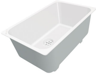
Cubeta blanca 8153 100